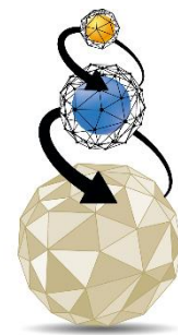
Triple Layer Technology Tecnologia a Triplo Strato

IMPERIAL FOOD gebruikt een unieke productietechniek, die het mogelijk maakt om de voordelen van de twee meestgebruikte productietechnieken van hondenvoer te combineren. De speciale Triple Layer Technology is het resultaat van een technisch proces, geïntroduceerd door IMPERIALFOOD S.R.L. in 1987. Deze techniek bestaat uit twee fasen: allereerst het koken en extruderen van de geselecteerde ingrediënten, waarna in de tweede koude fase de essentiële voedingselementen toegevoegd worden. Hierdoor komende goede eigenschappen van het warme en koude proces samen.